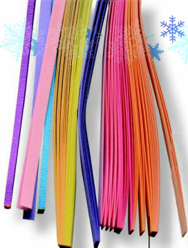
Полоски для квиллинга