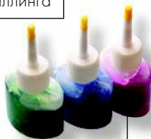
Глиттеры (блестки в виде лака или клея)