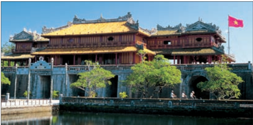
Хюэ. Ворота Нгомон, которые ведут в Запретный город

Женевская конференция позволила достичь лишь промежуточного соглашения. Вьетнам был разделен по 17-й