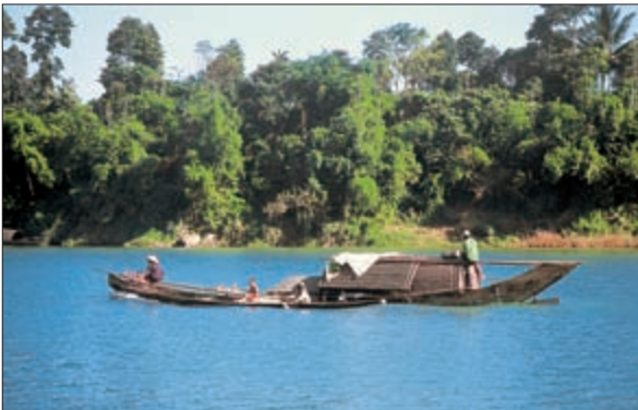
Лодки на Ароматной реке у города Хюэ

Помимо прекрасного климата, Вьетнам привлекает живописной природой и историческими достопримечательностями. Культура Вьетнама исключительна. Его прошлое не менее богато, чем плодородная почва речных дельт. Традиции здесь свято сохраняются. Вьетнамцы чтят своих предков, по-прежнему почитают древних героев и устраивают в их честь пышные храмо-