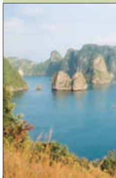
Спокойные воды залива Халонг

Суверенное государство Социалистическая Республика Вьетнам расположено в самом сердце Юго-Восточной Азии. По географическому положению страна напоминает огромную букву S, расположившуюся в восточной части Индокитайского полуострова. На севере Вьетнам граничит с Китаем, на западе — с Лаосом и Камбоджей. Общая протяженность от самой северной до самой южной точки — 1650 км.