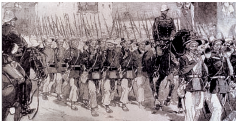
Вьетнамское подразделение французской армии, XIX в.

параллели. В результате всеобщие свободные выборы, запланированные на июль 1956 г., были сорваны. Демилитаризованная буферная зона отделяла север страны, контролируемый Вьетминем, от юга, где все еще оставались французы. Антикоммунист Нго Динь Зьем, назначенный премьер-министром Южного Вьетнама, сместил императора Бао-Дая и начал жестокую борьбу со своими противниками. На его соести гибель более чем 50 000 человек.