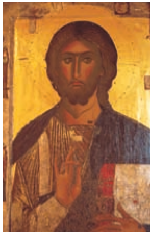
Икона из Византийского музея

Рядом находится Музей национальной борьбы (Mouseio Agonos; открыто: июль — август пн–пт 8.00–