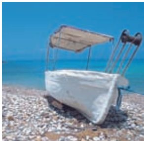
Идиллическая пляжная сценка

Главным достоянием Кипра на протяжении веков была медь. Это чувствуется и сегодня по цветам национального флага. А в современном мире основное богатство острова — солнце. Здесь насчитывается 340 солнечных дней в году. Однако на «острове Афродиты» порой довольно легкомысленно относятся к побережью, стремясь извлечь выгоду из каждого лучика солнца. Многие курортные города слишком велики и бездумно застроены. Они не обладают ни исторической, ни культурной атмосферой. Битва за сохранение девственных участков побережья почти проиграна. Но, чтобы восхититься островом, вам не придется ехать далеко. Достаточно чуть-чуть отъехать от побережья в глубь острова, и вас ждут очаровательные виноградники и скалистые горы. История Кипра невероятно богата. Люди поселились здесь еще в каменном веке. А затем здесь жили греки, персы, римляне, византийцы, крестоносцы, венецианцы, турки и британцы. И каждый народ оставлял в облике Кипра свой след.