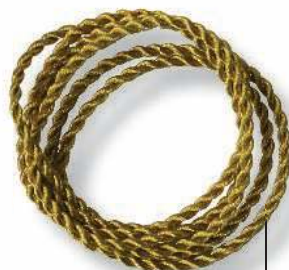
Витые шнуры для штор

Зажигалка для оплавления концов трикотажного или шелкового шнура