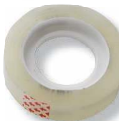
Узкий скотч для закрепления концов витого шнура