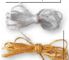
Ленточки и шнуры