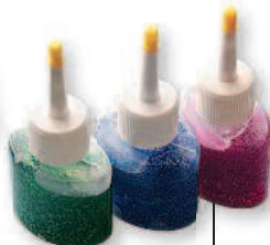
Глиттеры в тьюбиках