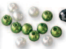
Бусины разных форм и размеров