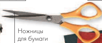
Ножницы для бумаги