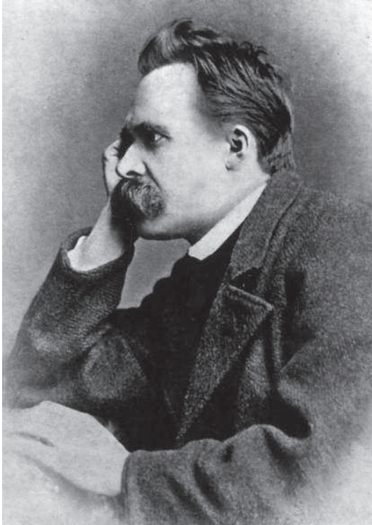
Фридрих Ницше в 1882 году