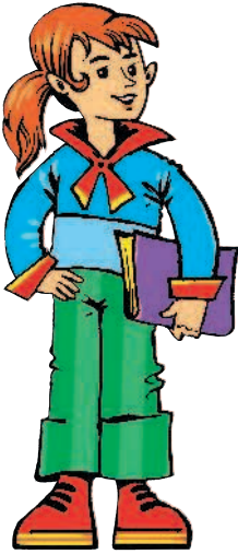
die Schwester [швэстэр] сестра