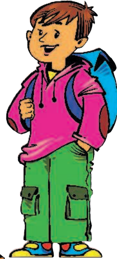
der Bruder [брудэр] брат