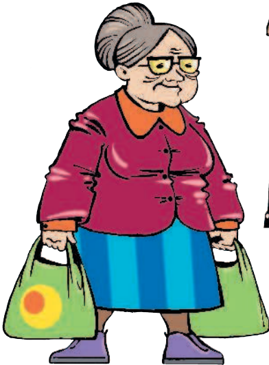
die Oma [ома] бабушка