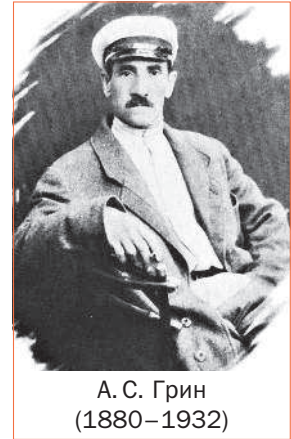
А. С. Грин (1880–1932)

В любимой Гринем Феодосии, в доме, где он жил, открыт волшебный музей. Музей парусников и шхун, где из угла выступает нос корабля, где живут морские фонари, канаты и подзорные трубы, унося 1 с собой посетителей в карту «Гринландии» с новыми мысами и проливами, с городами Гель-Гью, Лисс, Зурбаган.