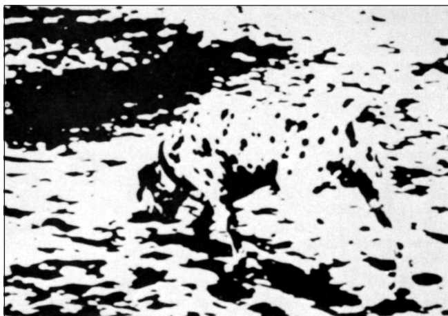
Рис. 1.2. Что вы видите?

ет контролировать вашу интерпретацию рисунка и делает это столь активно, что становится трудно не увидеть собаку.