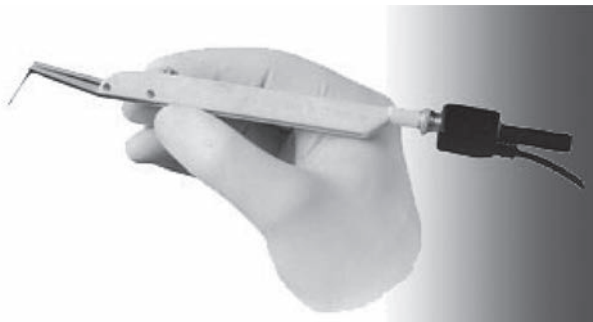
Рис. 4-2. Электронный зонд

«Флорида Проуб» (Florida Probe) представляет собой электронную измерительную диагностическую систему с компьютерной обработкой полученных результатов исследования пародонта. Титановый зонд имеет подвижную муфту диаметром 0,5 мм (рис. 4-2). Муфта обеспечивает плавность зондирования при постоянном давлении 20 г/см 2 . Точность воспроизводимости результатов составляет 0,2 мм.