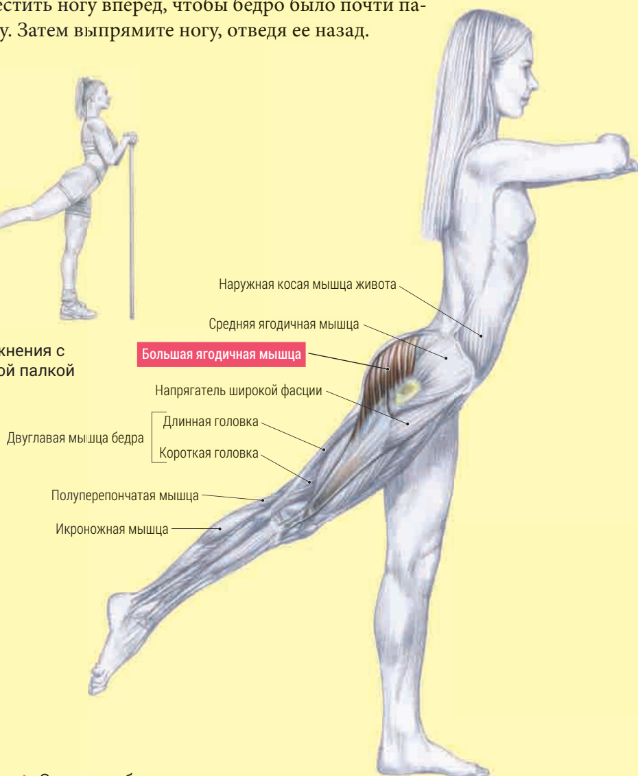
► Экстензия бедра стоя