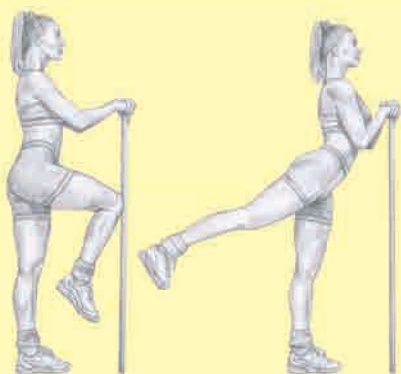
► Вариант упражнения с гимнастической палкой

Встаньте прямо, сведите ноги, отведите одну ногу назад и поднимите ее как можно выше за счет ягодичных мышц. Зафиксируйте эту позу на секунду, как можно сильнее напрягая ягодичные мышцы. Вернитесь в исходное положение и повторите. Выполнив подход для одной ноги, без паузы повторите упражнение для другой. Чтобы увеличить диапазон движения, можете переместить ногу вперед, чтобы бедро было почти параллельно полу. Затем выпрямите ногу, отведя ее назад.