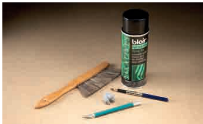
Различные художественные принадлежности

Я использую сетки со стороной квадратов 25 и 13 мм. Их легко нанести на пластик водостойким маркером. Кроме того, вы можете расчертить сетку на бумаге и размножить ее на прозрачных листах пластиковой кальки.