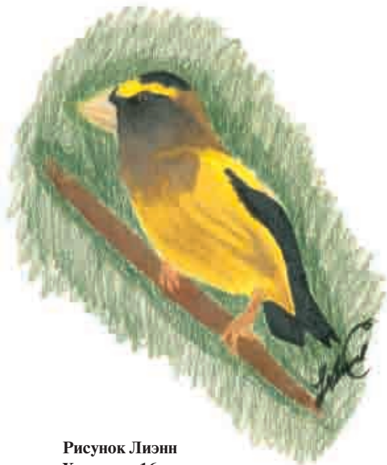
Рисунок Лиэнн Хэммонд, 16 лет

Мораль этой истории проста: вы тоже можете это сделать! Все, что вам требуется, это избавиться от старых воспоминаний о рисовании мелками, следовать моим указаниям и накапливать необходимый опыт. После того как вы прочувствуете особенности цветных карандашей, они перестанут вызывать у вас страх. Мои собственные первые результаты работы с цветными карандашами были плачевными, но теперь они стали одним из моих любимых художественных средств. Этот процесс требует много времени, настойчивости и практики. Многие ваши работы будут далекими от совершенства и недостойными, чтобы повесить их на стену. Но не судите себя слишком строго. Это неизбежная часть процесса обучения. (У меня в студии много корзин для мусора, и я не стесняюсь их использовать.) Со временем вы добьетесь результатов, которые вас приятно удивят!