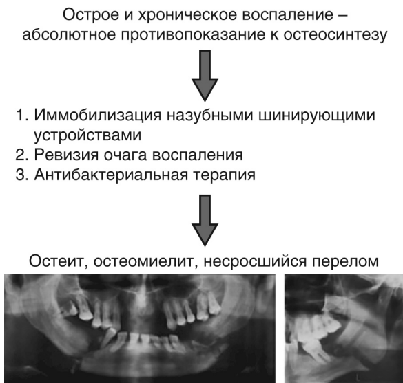
Рис. 5. Схема традиционной тактики лечения инфицированных переломов нижней челюсти

Именно поэтому комплекс лечебных мероприятий сводится в целом к трем основным процедурам: