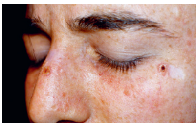
Рис. 25.1. Пигментная ксеродерма