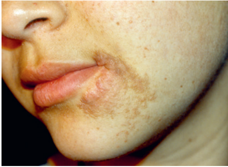
Рис. 25.8. Туберозный склероз. Ангиофибромы