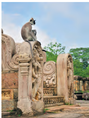
Руины Полоннарувы населяют длиннохвостые лангуры хануман

Первой возникла Анурадхапура , которая еще 2300 лет назад стала королевской столицей. В ее огромные монастыри стремились монахи со всего мира. Здесь растет самое старое дерево на свете – священное фиговое дерево Шри Маха Бодхи. На расстоянии всего нескольких километров в окружении величественных холмистых ландшафтов