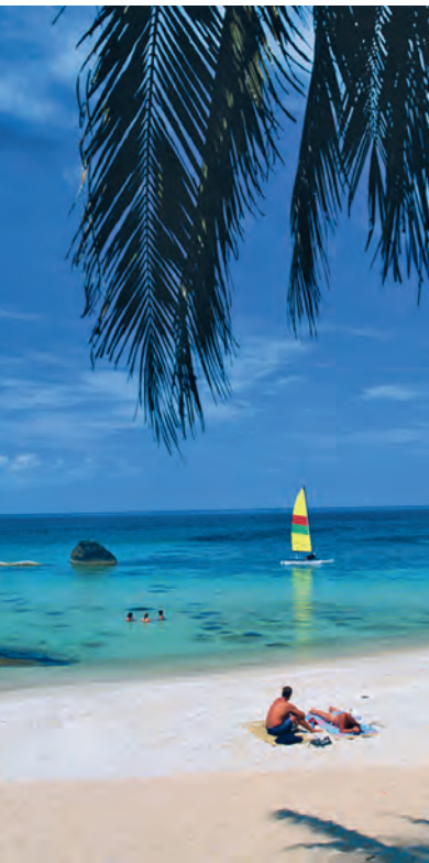
Отдых на острове Самуй

Для юга Таиланда характерны пляжи с золотистым или белоснежным песком. В лагунах некоторых островов оттенки морской воды варьируются от лазурного до изумрудного. Если настоящий отдых для вас – это купание в море, посещение ресторанов и дискотек, а также шопинг, то во время пика сезона, зимой, вам нужно ехать на Пхукет . Роскошные отели курорта балуют своих гостей велнес-центрами, а пивные бары пляжа Патонг не меньше славятся греховными удовольствиями, чем аналогичные заведения в Паттайе. Любите-