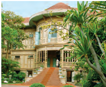
Красивое здание дворца Виманмек

Жаркий полдень лучше всего провести, осматривая экспозицию Национального музея E › с. 50. С причала Тхапхрачан отправьтесь на пассажирском катере Express Boat по реке Чаопхрайя в южном направлении к причалу Тхатъен. Здесь можно или пообедать в отличном ресторане отеля Arun Residence › с. 57, или просто сытно перекусить лепешками с различными начинками в уличном ресторанчике Roti Mataba › с. 59. Ресторан