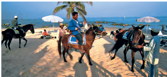
На пляже Хуахина желающие могут совершить прогулку верхом

точного побережья к югу от Паттайи и вокруг острова Самуй. Марина есть на Пхукете ( Asia Marine , www.asiamarine.net ), побережье которого считается самым красивым. В отелях и агентствах