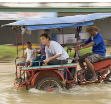
На улицах тайских городов в сезон дождей

Если вы решили поехать в Таиланд в сезон дождей, позаботьтесь о раннем бронировании мест в отелях и трансферах, так как периоды