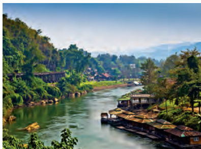
Река Квай у Канчанабури

Южнее Бангкока на западном побережье Сиамского залива расположен исторический город Пхетчабури . Еще дальше по побережью находятся Хуахин , бывший королевский морской курорт, и Национальный парк «Кхаосамройот» , известный своими живописными пейзажами.