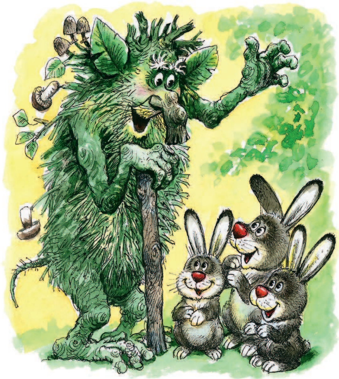
Рисунки А. Савченко