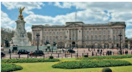
Букингемский дворец – официальная лондонская резиденция британских монархов

Вечер. Окунитесь в ночную жизнь Лондона. Короткая поездка на такси, и вы в клубе Notting Hill Arts Club (▷ 83), где звучит самая современная музыка самых модных течений, либо повеселитесь в Comedy Store (▷ 70), или послушайте джаз в Jazz Cafe (▷ 97).