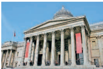
Национальная галерея содержит более 2000 образцов западноевропейской живописи XIII — начала XX века

Вечер. Оставьте достаточно времени, чтобы добраться до театра. Будьте внимательны: в антрактах не заказывайте напитки «под обрез», незадолго до того, как снова поднимется занавес! Если вы собираетесь поесть после спектакля, то заранее отыщите ресторан и закажите там столик до начала представления.