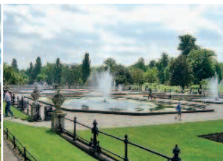
Гайд-парк – живописная зеленая зона отдыха, популярная у жителей и гостей британской столицы