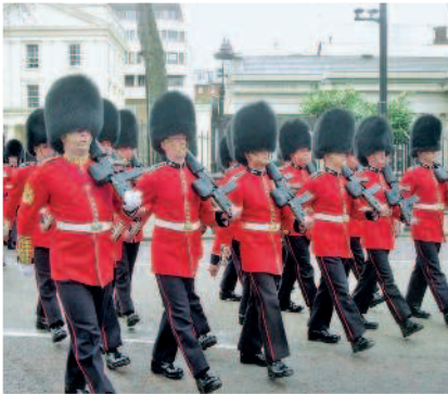
Дворцовые стражи Ее Величества