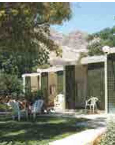
Гостевой дом в кибуце Эйн-Геди

Христианские конфессии содержат гостиницы в Иерусалиме и Галилее, а также вблизи других религиозных мест. Первоначально рассчитанные на паломников, они сегодня превратились в гостевые дома, по сервису и комфорту не уступающие