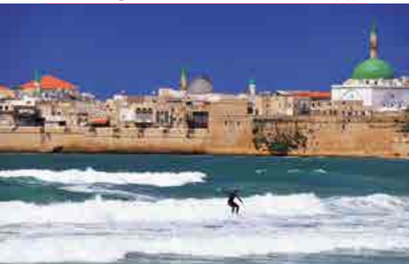
Серфингист на фоне Старого Акко

с. 83, посещая места, связанные с деяниями Иисуса: города Табха и Капернаум , Гору Блаженств > с. 87.