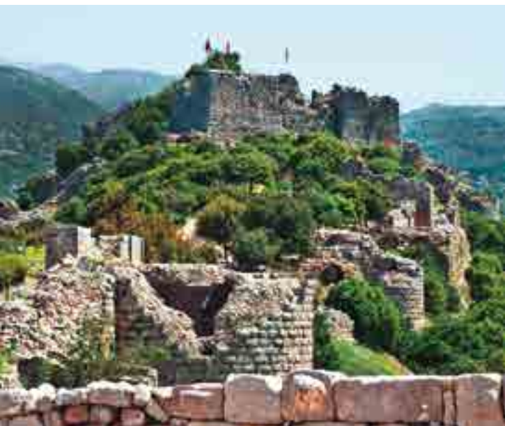
Крепость Нимрод была построена для контроля за дорогой из Галилеи в Дамаск

Из Каны по шоссе № 77 туристы попадают в Тверию > с. 85 на берегу озера Кинерет > с. 83. Если остановиться здесь на ночлег, то можно покататься на лодке по «Галилейскому морю». На следующий день путь лежит по шоссе № 90 на север; у Рош-Пины ответвляется дорога № 89, ведущая в Сафед (Цфат) > с. 89, один из четырех священных городов иудаизма с его многочисленными синагогами. У Хацора начинается долина Хула, регион интенсивного сельского хозяйства. Представление о простирившихся здесь когда-то болотах дает заповедник «Хула» > с. 91 – птичий рай. Переночевать можно в кибуце Кфар-Гилад, севернее городка Кирыат-Шмона > с. 91. На следующий день можно прогуляться по покрытому пышной растительностью заповеднику «Тель-Дан» > с. 91. На территории занятых Голанских высот расположен заповедник «Баниас (источник Хермон)» > с. 91 с одним из истоков Иордана. Конечным пунктом маршрута является расположенная на горе крепость Нимрод > с. 94, с которой открываются величественные виды на Голанские высоты.