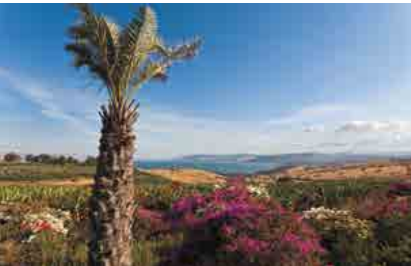
С Горы Блаженств открывается прекрасный вид на озеро Кинерет

Путешествие начинается в Иерусалиме > с. 98 , городе, где был осужден, распят и воскрес Иисус. На каждом шагу здесь встречаются памятники, воздвигнутые там, где происходили важные события жизни и страданий