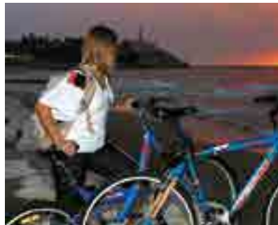
Остановка. Вид на Яффу

Многие популярные среди туристов регионы организуют путешествия на велосипедах. Составлены карты, предоставляются услуги хранения, транспортировки, проката. Так, один из маршрутов (общая протяженность 21 км) проходит в окрестностях Эйлата. Если вы предпочитаете более короткие велосипедные прогулки, то отправляйтесь в парки Иерусалима. Подробная информация в офисах по туризму или на сайте www.goisrael.ru .