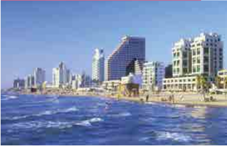
Пляж Тель-Авива. Здесь город предстает перед нами в современном, светском облике

ложились лечебные центры, обещающие облегчение людям, страдающим заболеваниями кожи и суставов. На значительной части пустыни Негев, занимающей более половины территории Израиля, благодаря интенсивному орошению развито сельское хозяйство. В центре пустыни можно увидеть одно из выдающихся природных достопримечательностей Израиля – гигантский эрозийный кратер Мехтеш Рамон. На самом юге пустыни Негев, прямо на берегу Красного моря, расположен город-курорт Эйлат, где купальный сезон длится круглый год.