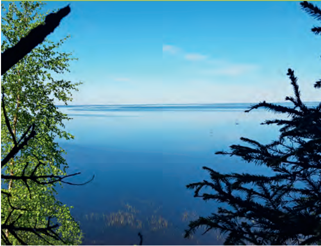
Самое крупное озеро – Псковско-Чудское

(3000) и большое количество малых и средних рек.