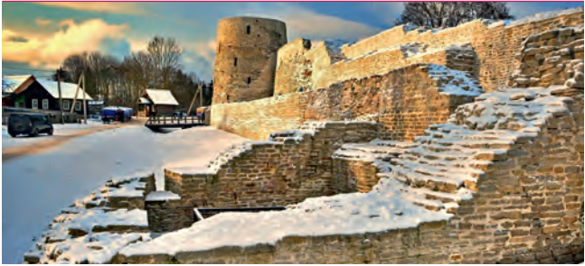
Древние крепостные стены Изборска

Область играет особую роль в развитии паломнического и религиозного туризма. И это не случайно: только в Пскове расположено около 40 действующих церквей, а в регионе – 10 действующих монастырей.