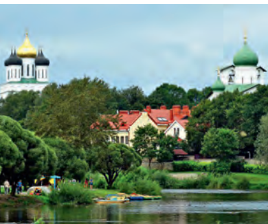
Финский парк (парк Куопио)

Направляемся к Троицкому мосту 3 . Он соединяет центр города (Кремль) с районом Запсковье. Первое упоминание о нем относится к 1388 г. В сер. XIX в. он обветшал настолько, что его пришлось полностью разобрать и установить чуть ниже по реке временный. В феврале 1847 г. император Николай I утвердил проект деревянного крытого моста по системе американского инженера Тауна, конструкции мостов которого применялись в Америке и Канаде для переправы через бурные горные реки. Осенью 1849 г. однопролетный мост длиной 42,6 м был открыт (инж. М. Краснопольский). Он получил название «американский» и