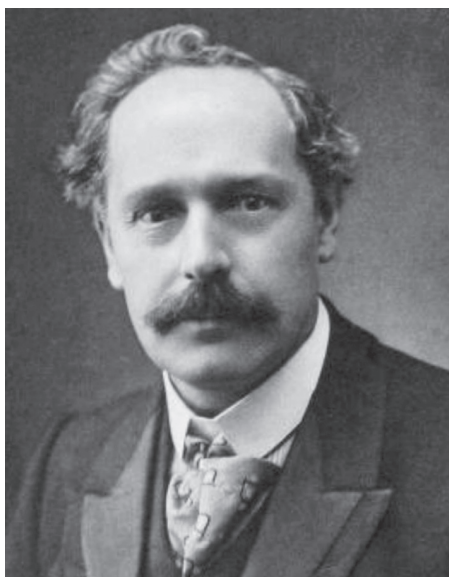
Артур Уэйт в 1906 году