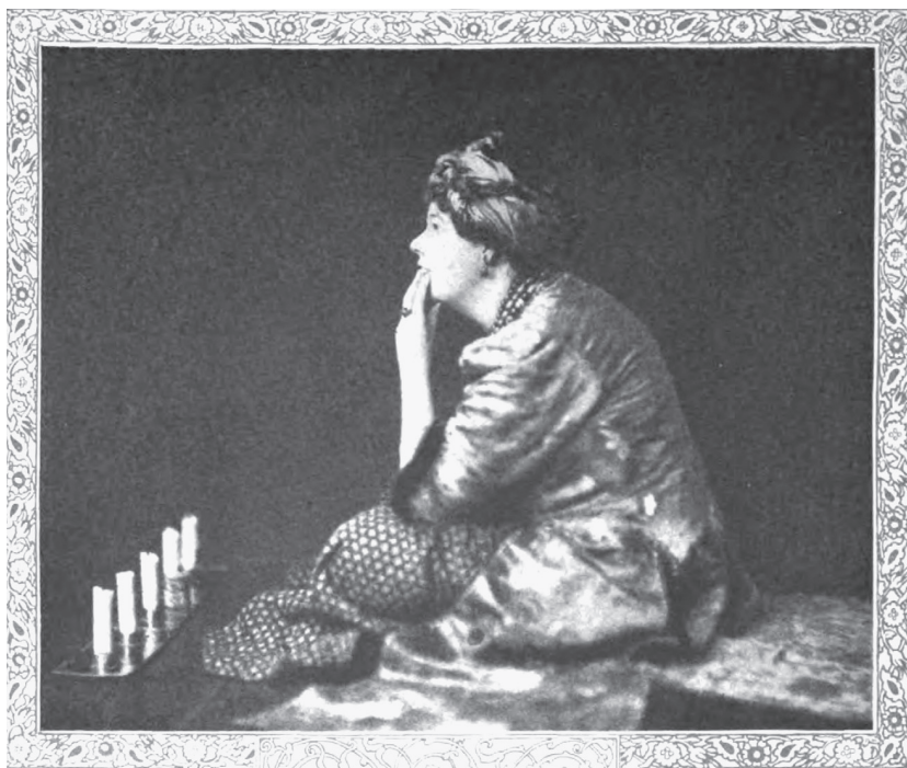
Памела Колман-Смит рассказывает историю, 1912 год