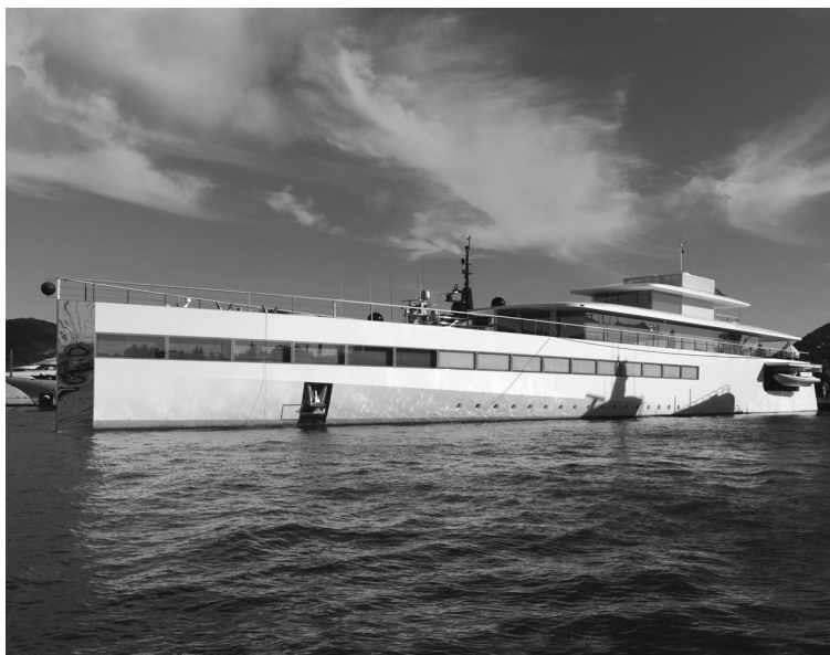
Яхта Стивена Джобса «Venus»