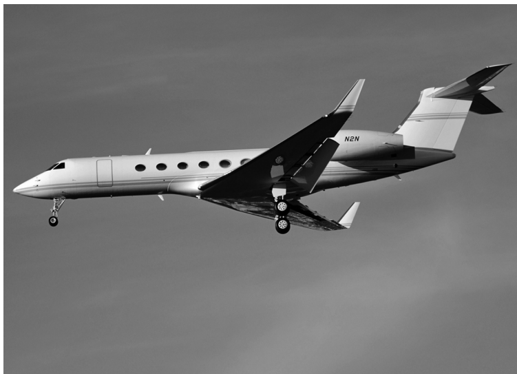
Реактивный самолет бизнес-класса Gulfstream G550 , предоставленный фирмой «Apple» Джобсу в личное пользование