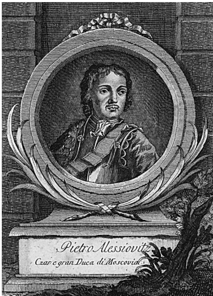
Pietro Alessiovitz Czar e gran Duca di Moscovia.