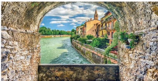
Живописный балкон с каменной аркой с видом на реку Адидже в центральной части Вероны

День третий. Посвятите романтике! Сходите к Дому Ромео (▷ 62) и в Дом Джульетты (▷ 40) со знаменитым балконом, Стеной Любви и музеем, посвященным влюбленным. Коснитесь статуи Джульетты, если верите в приметы, и оставьте ей послание. Дойдите до гробницы шекспировской красавицы (▷ 82), там же посетите Музей фресок (▷ 85), в средние века эти прекрасные произведения искусства украшали дома города. Вечером прогуляйтесь до холма Сан-Пьетро – здесь в древности возникли первые поселения людей. Поднимитесь на холм – популярное место прогулок влюбленных парочек. Полюбуйтесь раскинувшейся перед вашим взором панорамой города, полюбуйтесь закатом, заливающим черепичные крыши Вероны золотым светом заходящего солнца.