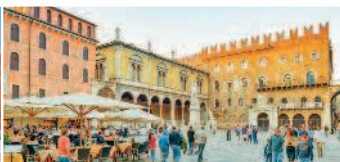
Площадь Пьяцца делле Эрбе