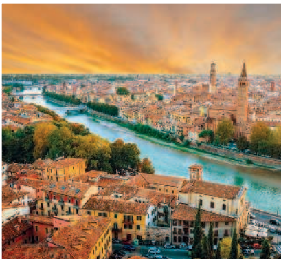
Вид на Верону