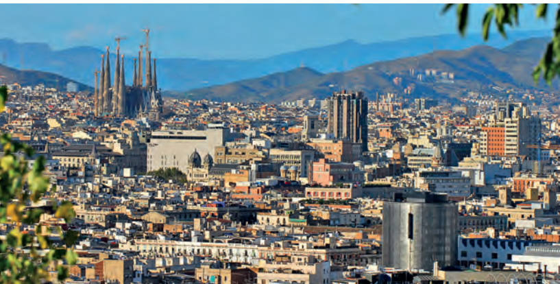
Уникальное сочетание современной и старинной архитектуры

Примерно через 40 лет началась застройка района вблизи горы Монжуик . Здесь Барселона принимала Всемирную выставку 1929 г. Многочисленные парки, музейные павильоны представляют интерес не только для ино-