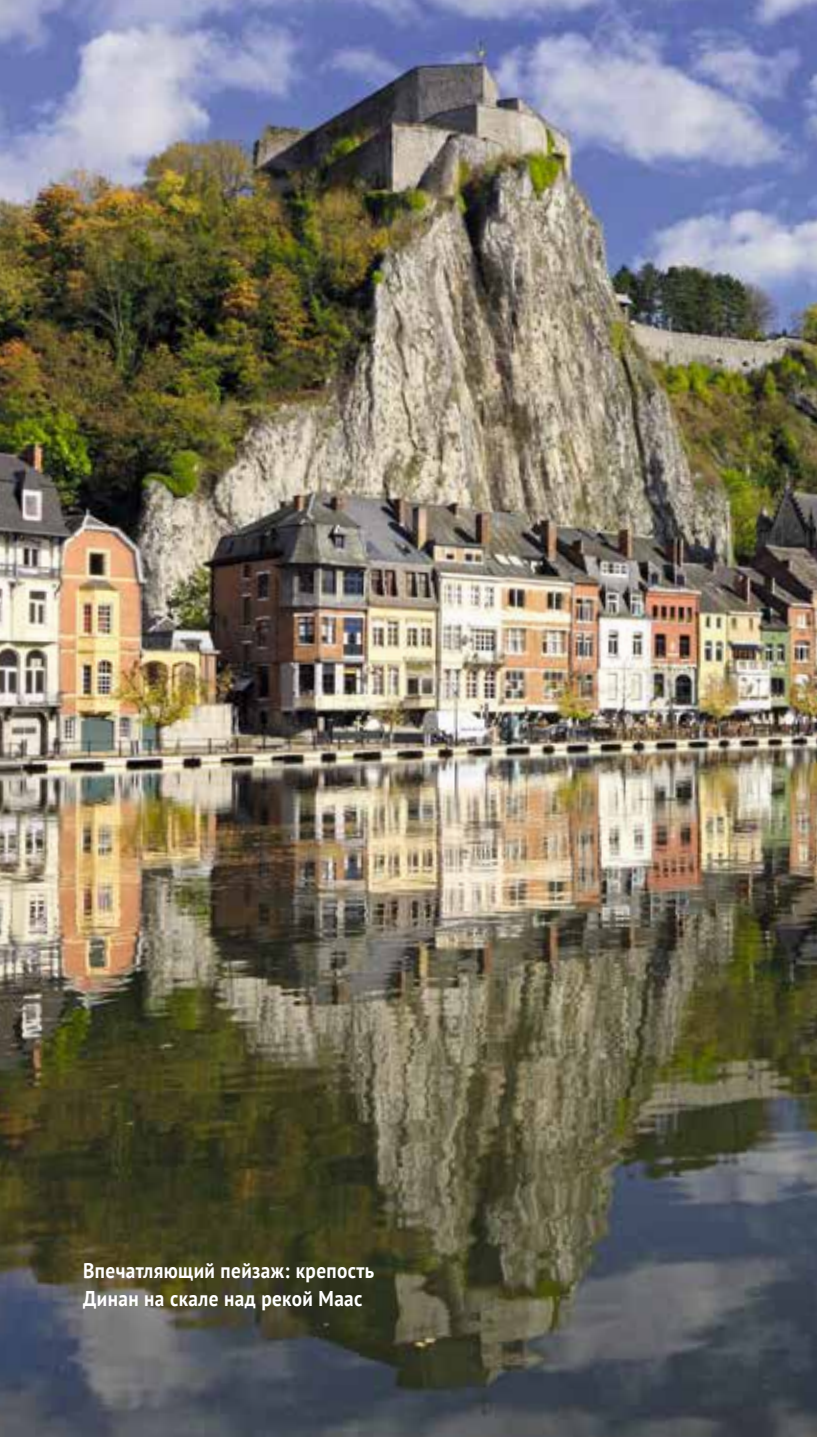
Впечатляющий пейзаж: крепость Динан на скале над рекой Маас