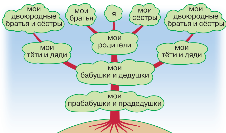
Схема родословного дерева