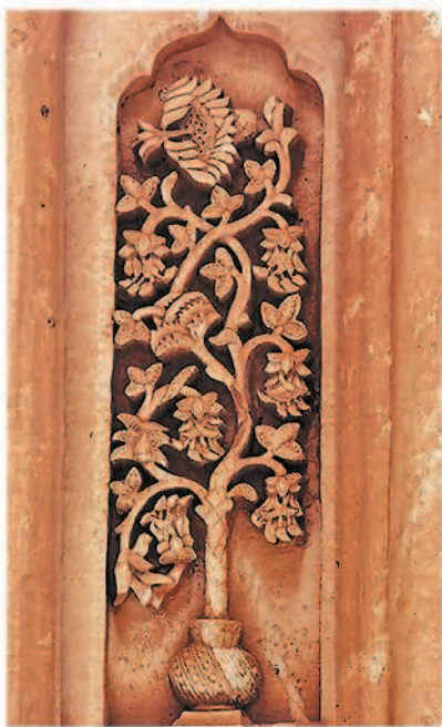
Мировое дерево в культуре разных народов