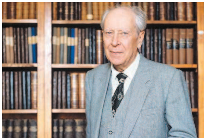
Дмитрий Сергеевич Лихачёв

Люди издавна населяют и преобразуют Землю — наш общий дом. Известный российский учёный, историк Дмитрий Сергеевич Лихачёв сказал об этом: «Когда-то... мне пришёл в голову такой образ: Земля — наш