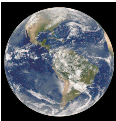
Планета Земля из космоса