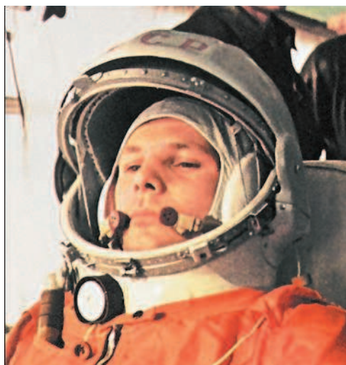
Первый космонавт Юрий Алексеевич Гагарин

Планета Земля удивительно красива. Первый космонавт мира, наш с вами соотечественник Юрий Алексеевич Гагарин, вернувшись из полёта, сказал: «Облетев Землю в корабле-спутнике, я увидел, как прекрасна наша планета. Люди, будем хранить и приумножать эту красоту, а не разрушать её!»