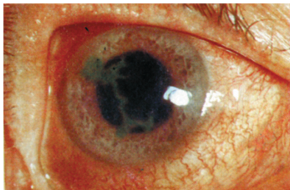
Рис. 9.3. Древовидный кератит

Клиническая картина. При поверхностных герпетических кератитах на роговице появляются полупрозрачные пузырьки, приподнимающие эпителий. Пузырьки быстро лопаются, остаются язвочки, при древовидном кератите язвочки сливаются, образуя «серые линии», напоминающие ветку дерева (рис. 9.3). Такая картина обусловлена распространением процесса по ходу поверхностных роговичных нервов.