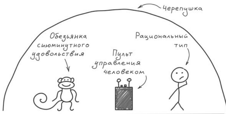
Рис. 3. Модель Тима Урбана

В отличие от рационального типа обезьянка не способна извлекать уроки из прошлого и на основании их как-то корректировать настоящее, чтобы повлиять на будущее. У обезьянки есть только «здесь и сейчас».