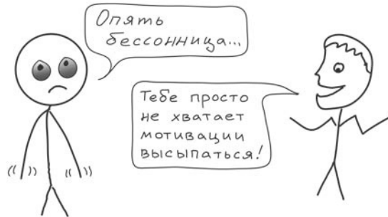
Рис. 2. Не высыпаетесь – ты просто недостаточно сильно этого хочешь...

Неужели это все из-за того, что вы были недостаточно мотивированы, чтобы выспаться перед очередным важным событием?