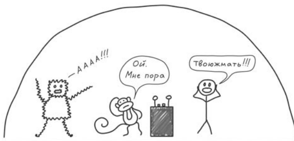
Рис. 4. Панический монстр