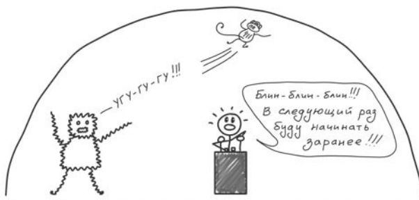
Рис. 5. Собран, сосредоточен, сконцентрирован

Это панический монстр — персонаж, появляющийся в те моменты, когда что-то начинает серьезно угрожать нашей безопасности или карьере. Обезьянка его боится. Она покидает насиженное место и сваливает, оставляя у руля рационального типа.