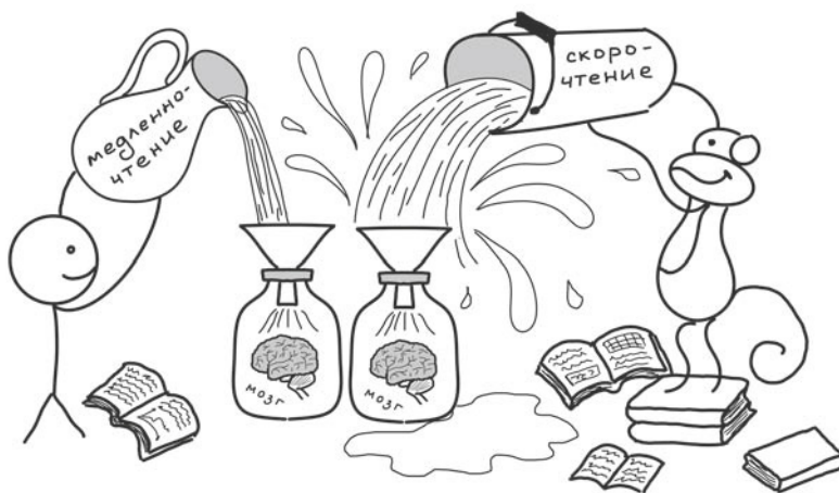
Рис. 1. Медленночтение и скорочтение

Не торопитесь — так будет быстрее. Если ваша цель — изменить свое поведение или взгляды на жизнь, скорость потребления информации вряд ли будет для вас решающим параметром. Знания усваиваются медленно.