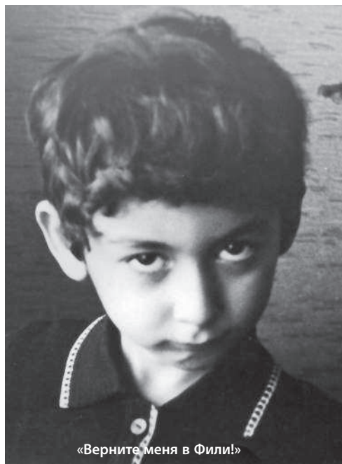
«Верните меня в Фили!»

Собственно, весь этот кусок Ленинградского района Москвы был внедрен в большую деревню Аксиныно, остатки которой лежали по ту сторону от нашего нового дома на улице Смольной. Вдоль дороги