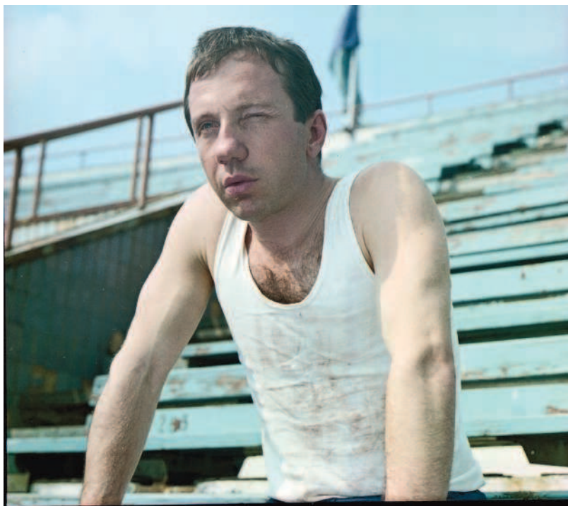
Савелий Крамаров, фрагмент из к/ф «Джентльмены удачи»