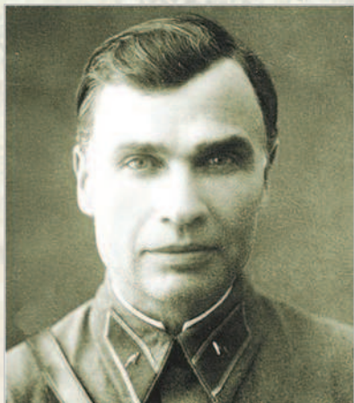
Командующий войсками Юго-Западного фронта, Герой Советского Союза, генерал-полковник Михаил Кирпонос (1892—1941). Погиб 20 сентября 1941 г. во время отступления из-под Киева.

Верховный главнокомандующий Вооруженными силами СССР И. Сталин издал приказ, гласящий «оборонять Киев до конца». Советские солдаты мужественно сражались против двух танковых групп германских войск, поддержанных пехотными дивизиями и воздушным флотом. Но силы были слишком не равны. И 15 сентября 1941 г. германские армии сомкнули гигантское кольцо вокруг киевской группировки РККА. Но и в окружении красноармейцы еще несколько недель продолжали упорно сражаться. Таким образом, город Киев на время прикрыл столицу Советского Союза. Битва за украинскую столицу сковала силы германского вермахта, и советское командование успело подготовить Москву к обороне.