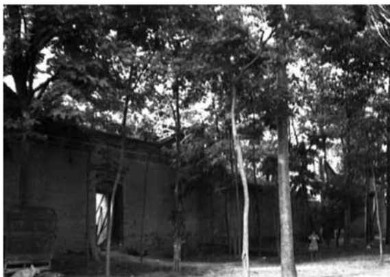
Дом-музей Си Чжунсюня в поселении Чжунхэ, в селе Дань уезда Фупин, в провинции Шэньси

с цинскими войсками, сопровождающими вдову императора Цыси, отправился в Чанъань. Старый дед рассчитывал, что его старший сын будет опорой, кормильцем семьи, и не мог предположить, что тот уйдет на войну и не вернется. Это, несомненно, стало сильным ударом для дедушки.