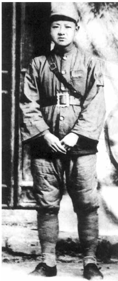
Апрель 1932 года. Си Чжунсюнь во время руководства «Военным мятежом в уезде Ляндан»

ленность участников подпольной парторганизации в дивизии была увеличена до 30 человек, что давало основание для создания официальной партийной организации. Получив согласие провинциального партийного комитета, в 1-й, 2-й и 3-й ротах были организованы партийные ячейки и учрежден партком. Секретарем парткома стал Си Чжунсюнь.