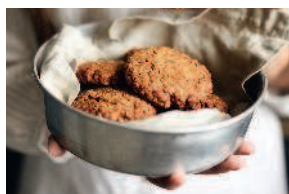
Овсяное печенье ..... 60