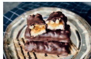
Батончик «Сникерс» ..... 137