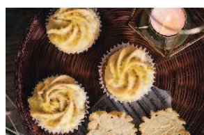
Облепиховые капкейки ..... 127