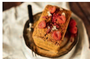
Кекс с чаем матча ..... 78