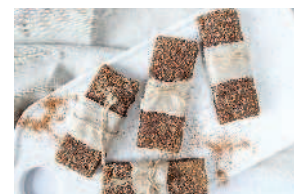
Raw-батончики ..... 71