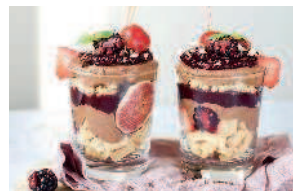
Трайфл ..... 103