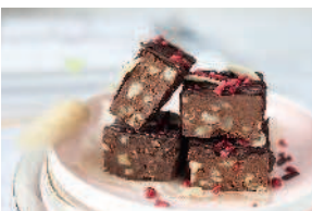
Пирожное «Тыквики» .... 118