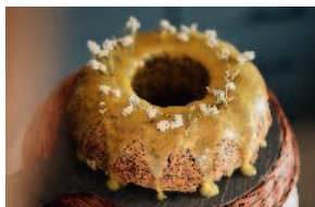
Кекс «Апельсин-мак» ..... 81