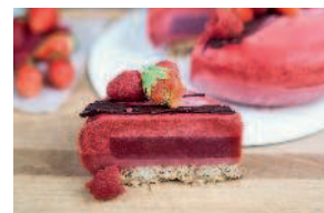
Ягодный муссовый торт..... 154