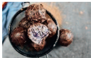
Трюфель с макадамией 133