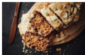
Тыквенный кекс..... 85