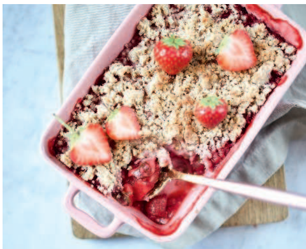
Крамбл с клубникой и ревенем..... 98