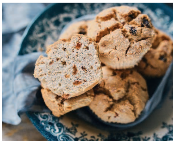
Мандариновые кексики ..... 82