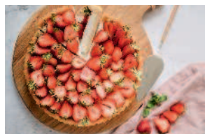
Тарт с заварным кремом и клубникой ..... 142