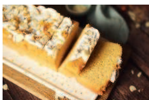
Кекс «Апельсин-миндаль» ..... 75