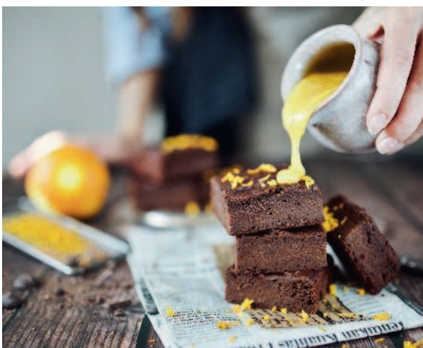
Апельсиновый брауни ..... 116