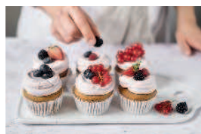
Клубничные капкейки ..... 124