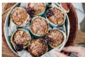
Гречнево-миндальные маффины ..... 72