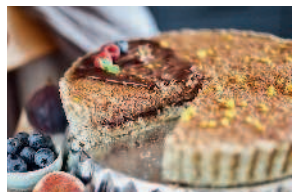
Тарт «Апельсин-шоколад» .... 145