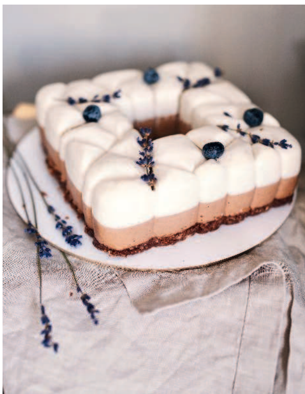
Торт «Два шоколада»..... 147