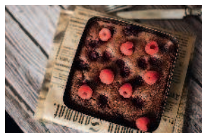
Финансье с вишней ..... 90