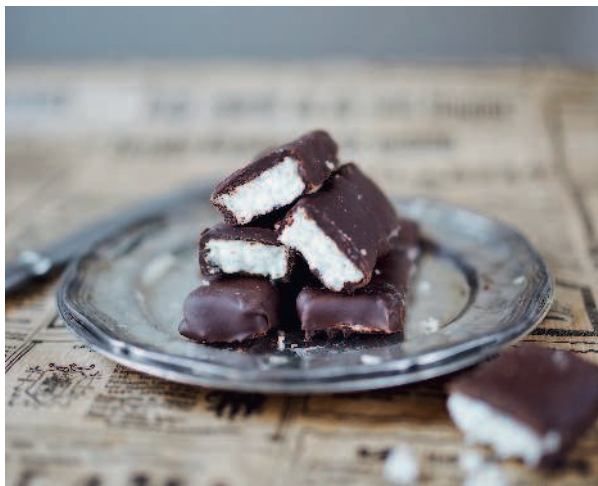
Батончик «Баунти»..... 134