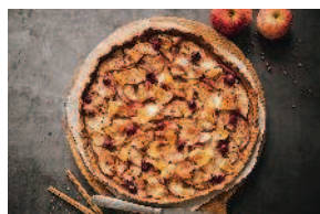
Ржаная галета с яблоками и клюквой..... 68