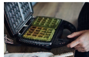
Вафли «Матча» ..... 93