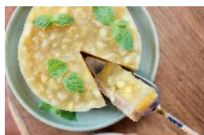
Яблочный торт с апельсином и манго... 139