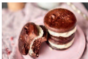
Вуппи-пай ..... 66