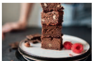
Брауни с карамелизированным фундуком..... 109