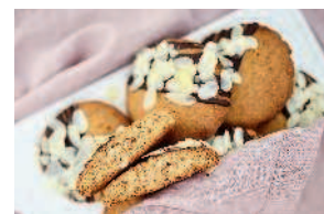
Миндальное печенье ..... 62