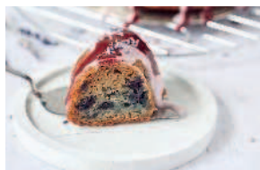
Черничный кекс с лавандой ..... 87