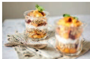
Парфе с персиками и зеленой гречкой ..... 97