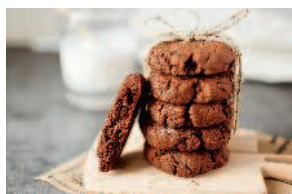
Шокопеченье ..... 65