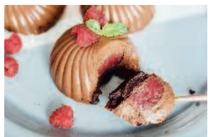
Муссовые пирожные «Шоколад-малина» ..... 113