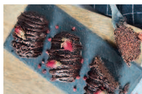
Пирожное «Картошка» ..... 106