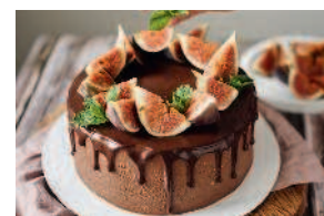
Шоколадный торт ..... 151