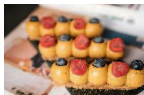
Десерт «Oh, my godji!»... 122