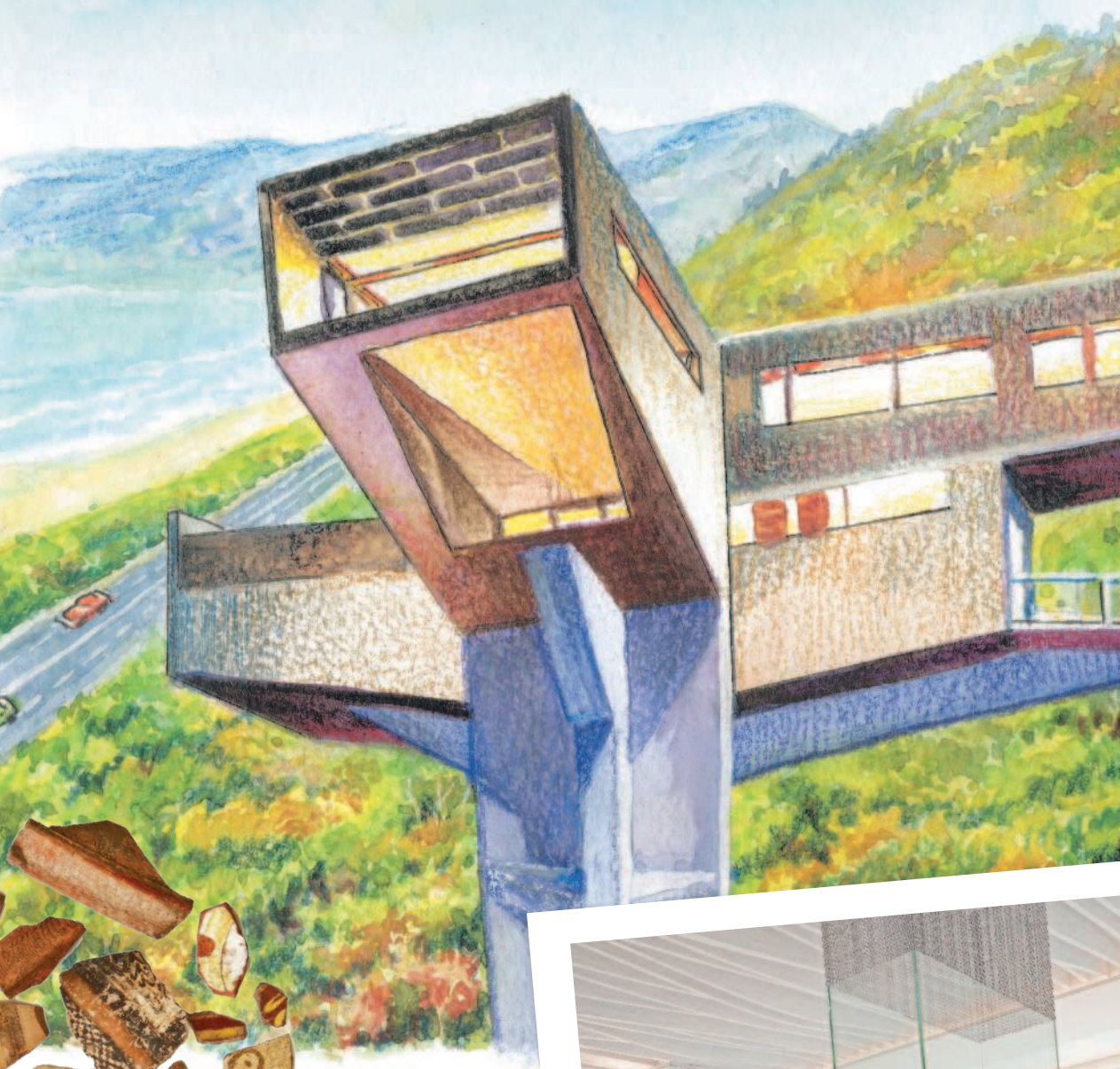
Дом-дерево в Австралии.

Интерьер современного дома, оформленного в стиле нью-фьюжн.