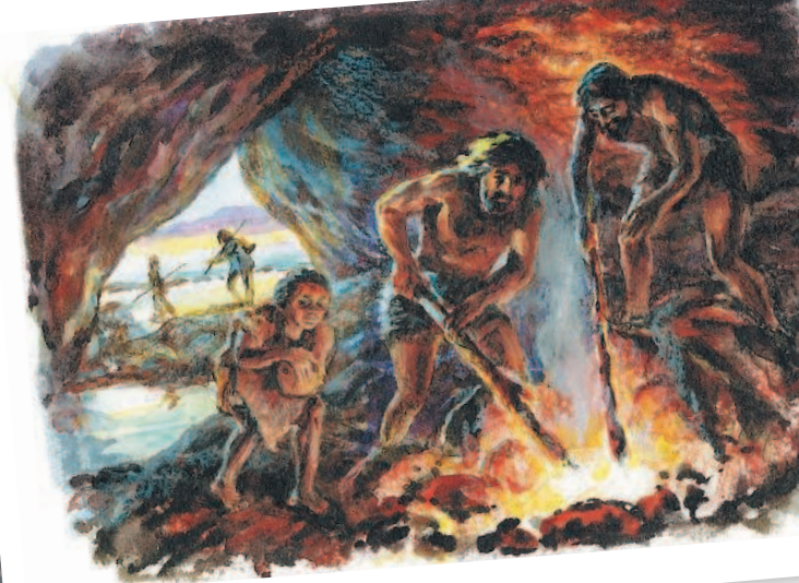
Палеозой. Роспись пещеры