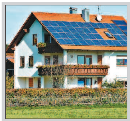
Рис. 5. Дом с солнечными панелями на крыше

• воздух в помещениях нагревается за счёт солнечных лучей через большие окна со специальными стеклопакетами;