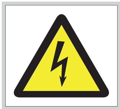
Рис. 4. Знак предупреждения об опасности поражения электрическим током

Энергоснабжение – это обеспечение поставок электричества, газоснабжение (поставка газа), теплоснабжение (поставка горячей воды и тепла).