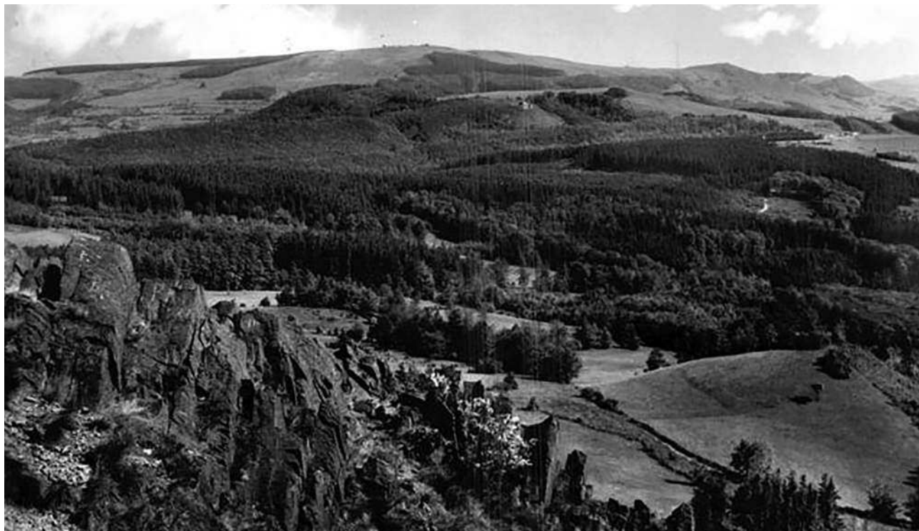
Плато Вассеркуппе в горах Рён