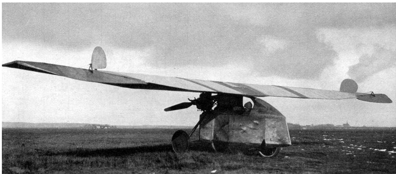
С таких вот летательных аппаратов началось зарождение Люфтваффе!

песчаной косе Курише Нехрунг, расположенной между Балтийским морем и заливом Фриш-Хафф. Вылеты там выполнялись с прибрежных песчаных дюн, имевших высоту от 45 до 60 метров. В 1921 году студенты Дармштадтского технического университета создали Академическую авиационную группу (Akademische fliegergruppe — сокр. Акафlieg), которая должна была играть ведущую роль в развитии немецкого планеризма.