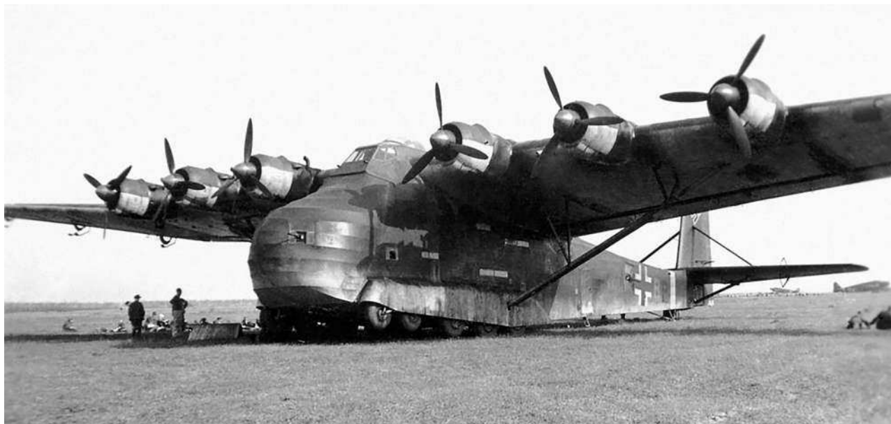
Гигант на аэродроме в Италии. 1943 г.

только восполнить свои первоначально довольно скромные военные ресурсы, но и значительно увеличить их.