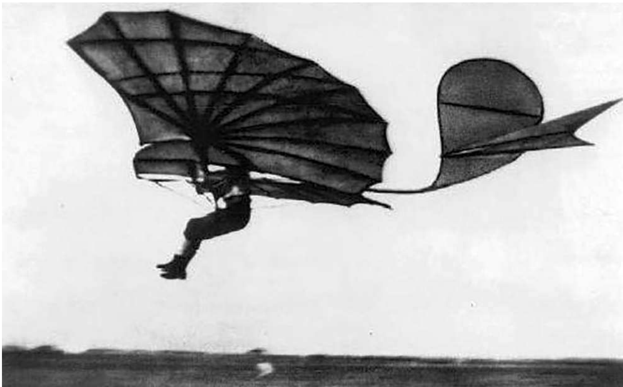
Отто Лилиенталь совершает полет на планере. Берлин, 1895 г.

В 1909 году, после посещения одного из первых международных авиасалонов во Франкфурте, два 15-летних немецких школьника из Дармштадта, Ханс Гутермут и Бертольд Фишер, создали вместе с тремя