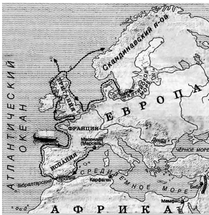
Приблизительный маршрут плавания Пифея

ночью. Мы можем определенно утверждать, что и две, и три, и пять тысяч лет назад человечество уже ведало о том, что есть на белом свете Арктика (страна, лежащая под созвездием Большой Медведицы, которое зовется по-гречески Арктос).