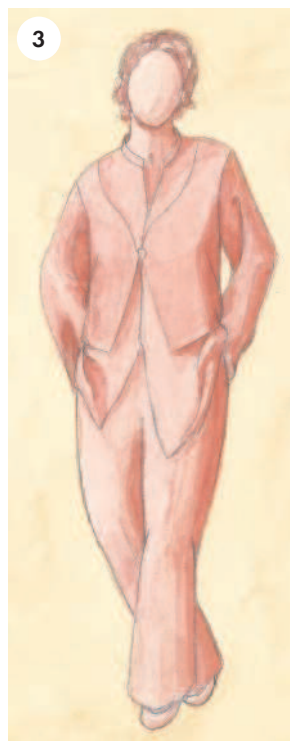
3 Свободный силуэт