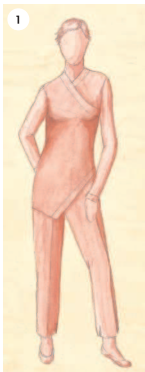
1 Облегающий силуэт

Свобода кроя означает разницу между размерами готового изделия и размерами тела человека. Когда речь идет об одежде из плотной ткани, то она должна хотя бы минимально отличаться от размеров тела, иначе двигаться в ней будет попросту невозможно. Эта разница обеспечивает свободу ношения и называется техническим припуском или припуском на свободу облегаия.