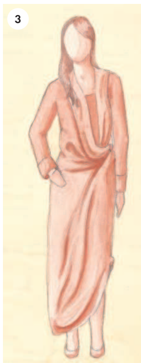
3 Умеренно свободный силуэт