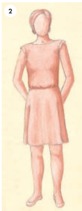
2 Расслабленный силуэт