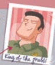
King of the grabbi

Броже как под этой чёлкой должна быть глаза, но похоче, это всё таки бездушки