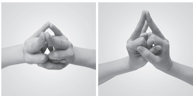
Рисунок 1. Мудра драгоценного камня