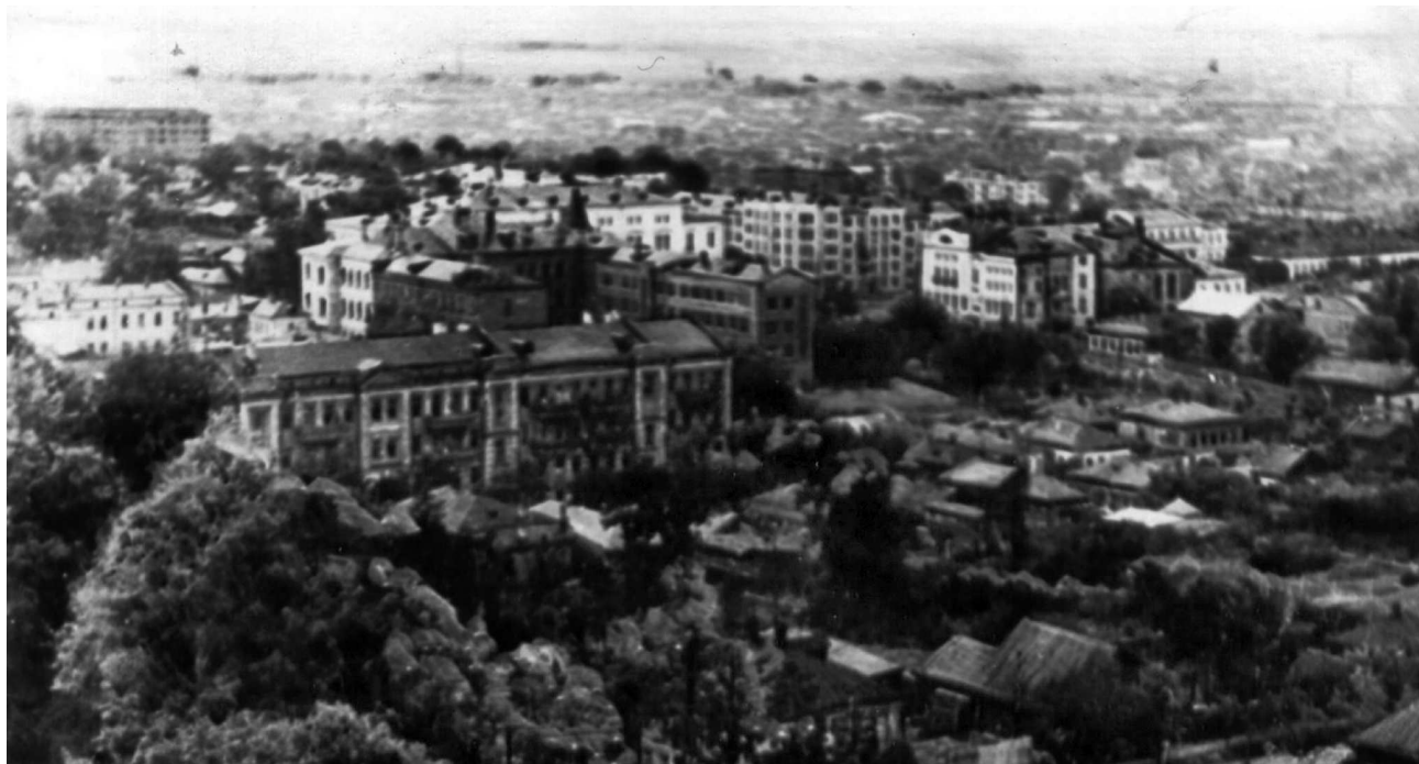
Вид г. Тулы. 1941 год.

саперная подготовка, топография, подрывное дело, борьба с танками противника, санитарная подготовка, дисциплинарный устав. 1 По похожей программе осваивали азы военного дела и бойцы подразделений народного ополчения, а также слушатели всеобуча.