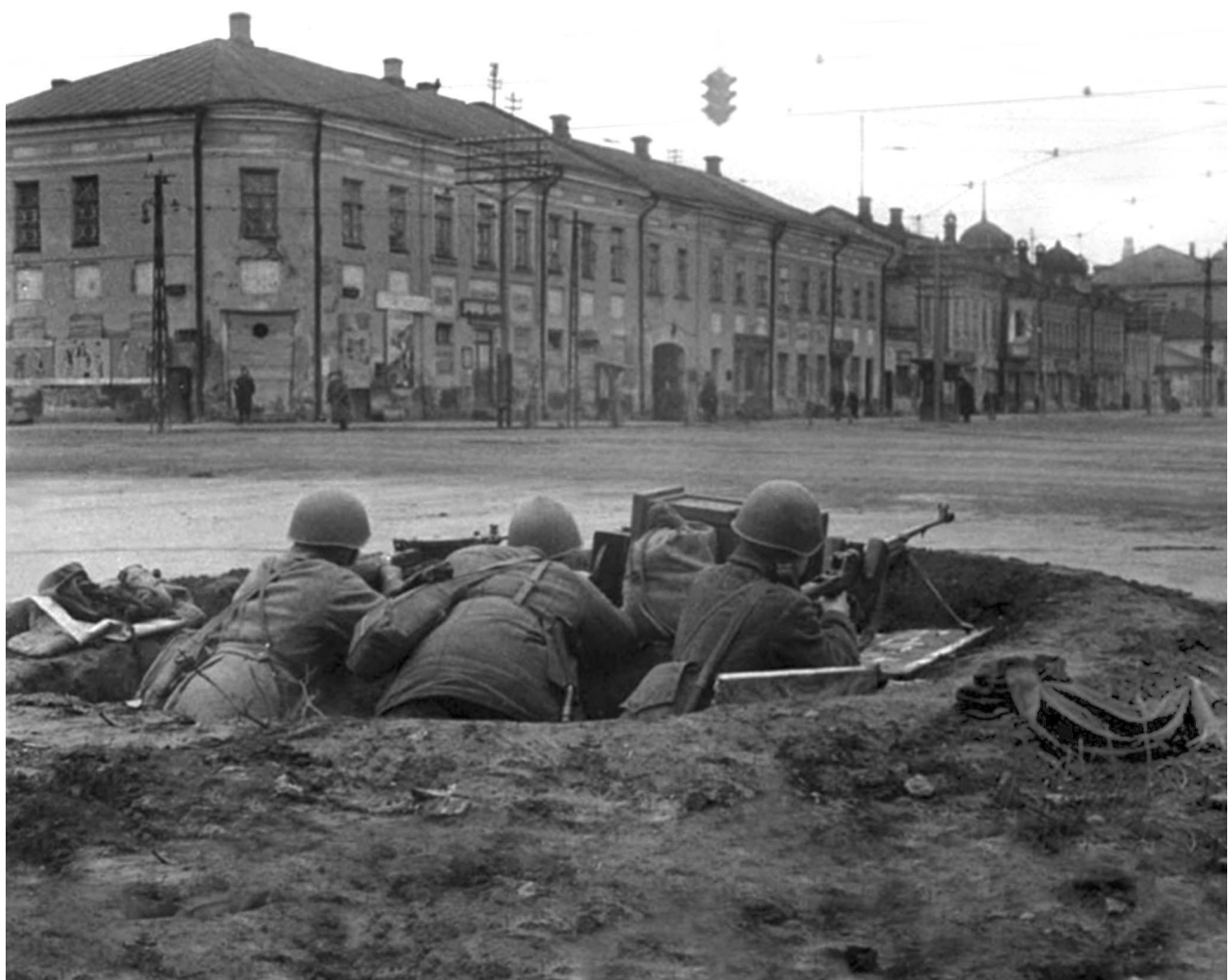
Бойцы в окопе на перекрестке улиц Коммунаров и Советской. Тула, октябрь 1941 года.