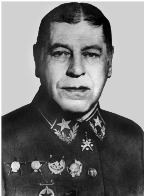
Начальник Генерального штаба РККА Маршал Советского Союза Б.М. Шапошников.

После войны Г. Гудериан в чине капитана продолжил службу в штабе «Железной дивизии» на территории Латвии, далее командовал ротой, затем батальоном. С 1928 г. инструктор по тактике автотранспорта в штабе Рейхсвера. В феврале