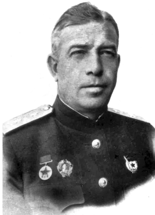
Командующий 50-й армии генерал А.Н. Ермаков (послевоенная фотография).

13 октября Г.П. Коротков организовал штаб обороны, который возглавил лично.