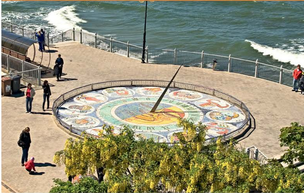
Солнечные часы на набережной

влечений с тремя бассейнами и множеством аттракционов. Особой популярностью у туристов пользуется канатная дорога, доставляющая отдыхающих с высокого берега на пляж. ! Работает постоянная ярмарка сувениров, повсюду торгуют янтарем.