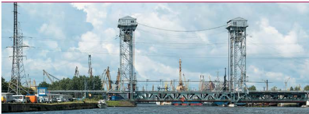
Калининградский порт – наше «окно в Европу»

сторону – минимум 2674 руб. Из Москвы компания «Аэрофлот» ежедневно осуществляет несколько рейсов. В Калининград летают самолеты авиакомпаний «Победа», «Уральские авиалинии» и UTair . От международного аэропорта Храброво до Южного вокзала регулярно курсирует автобусный маршрут 244-Э, среднее время в пути – 45 мин.