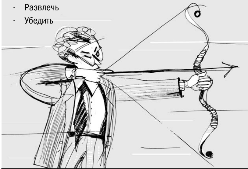
Рис. 3. Цели выступления