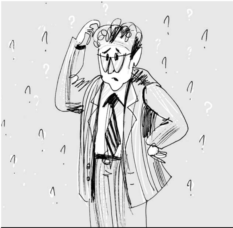
Рис. 2. Как сказать правильно, красиво и убедительно?

Вам предлагают выступить? Обязательно соглашайтесь, если у Вас есть в запасе не меньше недели на подготовку речи. Залог Вашего успешного выступления – тщательная подготовка, а все остальное – практика, практика, практика!