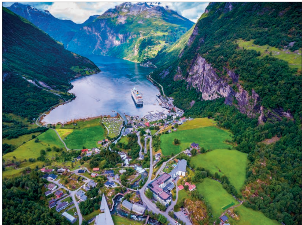
▼ В ясную погоду панорама Гейрангер-фьорда кажется будто нарисованной

В XIX в. небольшое рыбацкое поселение обрело статус города, который в 1904 г. полностью сгорел. Его довольно быстро отстроили заново, но уже в камне и в модном в то время в Европе стиле ар-нуво. Улица Конгенгате — яркий образец застройки в стиле модерн начала XX в. От городского парка Олесунна 418 ступенек ведут на смотровую площадку горы Аксча, откуда открывается панорамный вид на город и близлежащие острова.