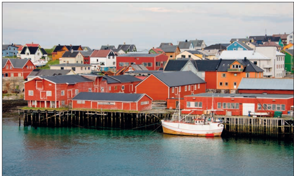
▼ Город Вардё расположен в глубине Варангер-фьорда недалеко от границы с Россией

Несмотря на удаленность от столицы, в течение года в Вардё проходит несколько фестивалей и значимых культурных событий. В ноябре — блюзовый фестиваль, в конце марта — фестиваль игры юкигассен, или снежный бой, а в июле — Поморский фестиваль.