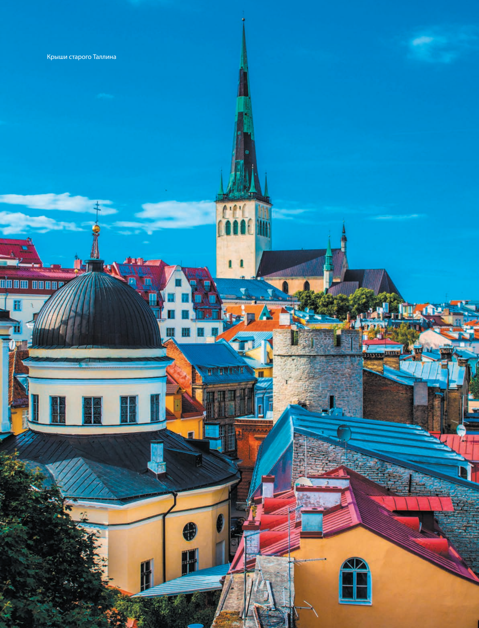
Крыши старого Таллина