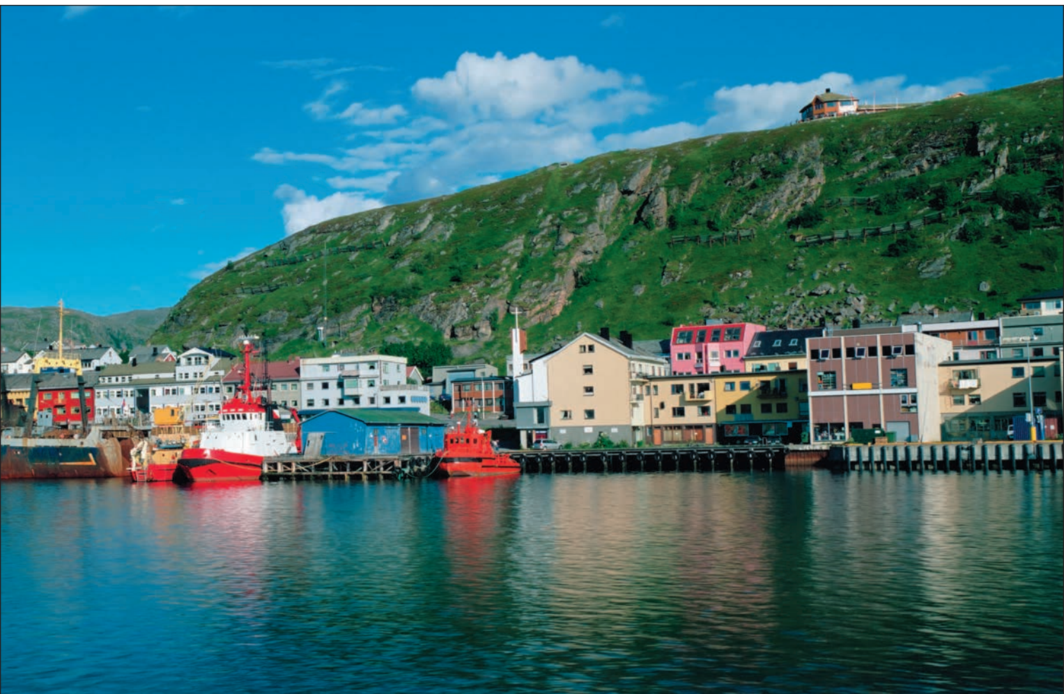
▲ Грузовые суда в порту города Киркенес

В 1740 г. зародилась поморская торговля между норвежцами и русскими. Поморы обменивали российское зерно и муку на здешнюю рыбу. Со временем российский рубль в Вардё стали использовать как местную валюту. Эта тенденция продолжалась до российской революции 1917 г.