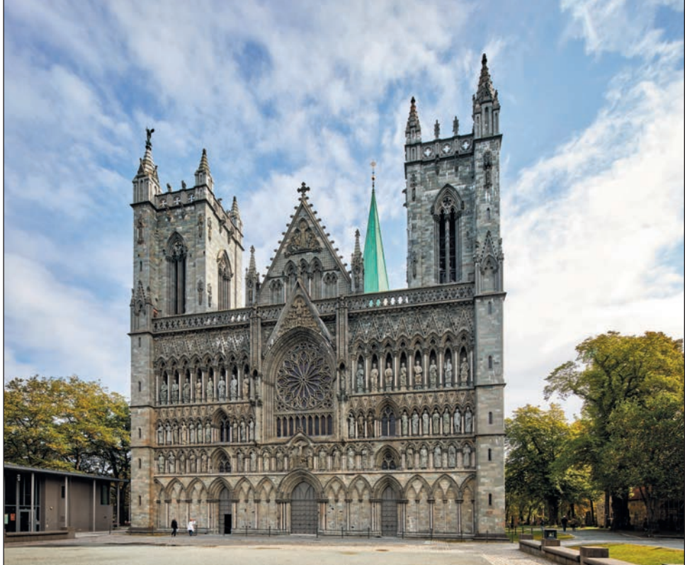
▲ Кафедральный собор Тронхейма

К северу от Тронхейма на берегу Атлантического океана расположен город Будё. Это столица норвежского Заполярья и один