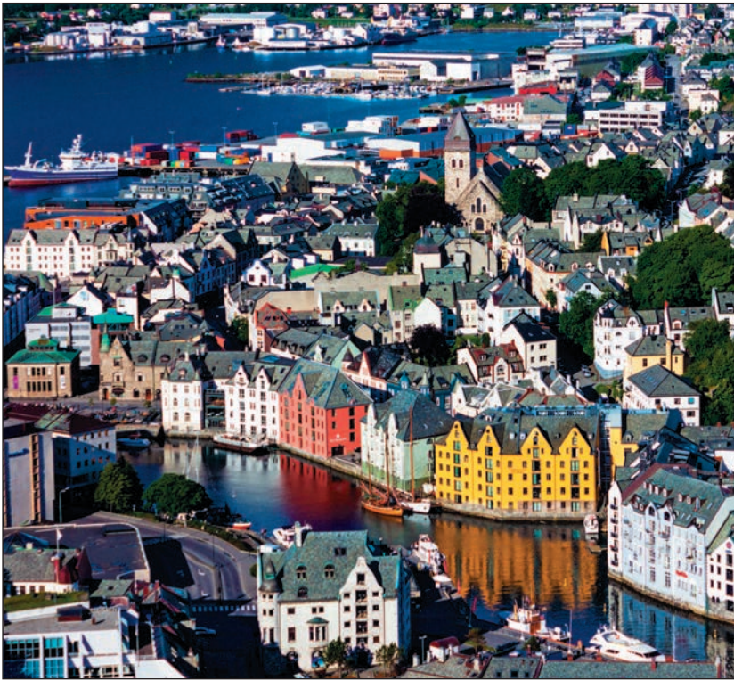
▲ Панорама города Олесунн