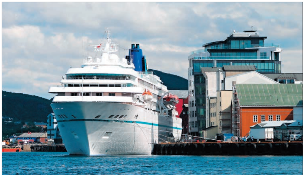
▼ Туристический лайнер делает остановку в гавани Будё

ваффе в 1940 г., но уже к началу 1959 г. город полностью восстановили. Сегодня в одном из уцелевших с той поры зданий размещается музей Сальтен. Его коллекция знакомит посетителей с историей и культурой Будё со дня его основания, а также с развитием рыболовства в регионе. Еще одно любо-