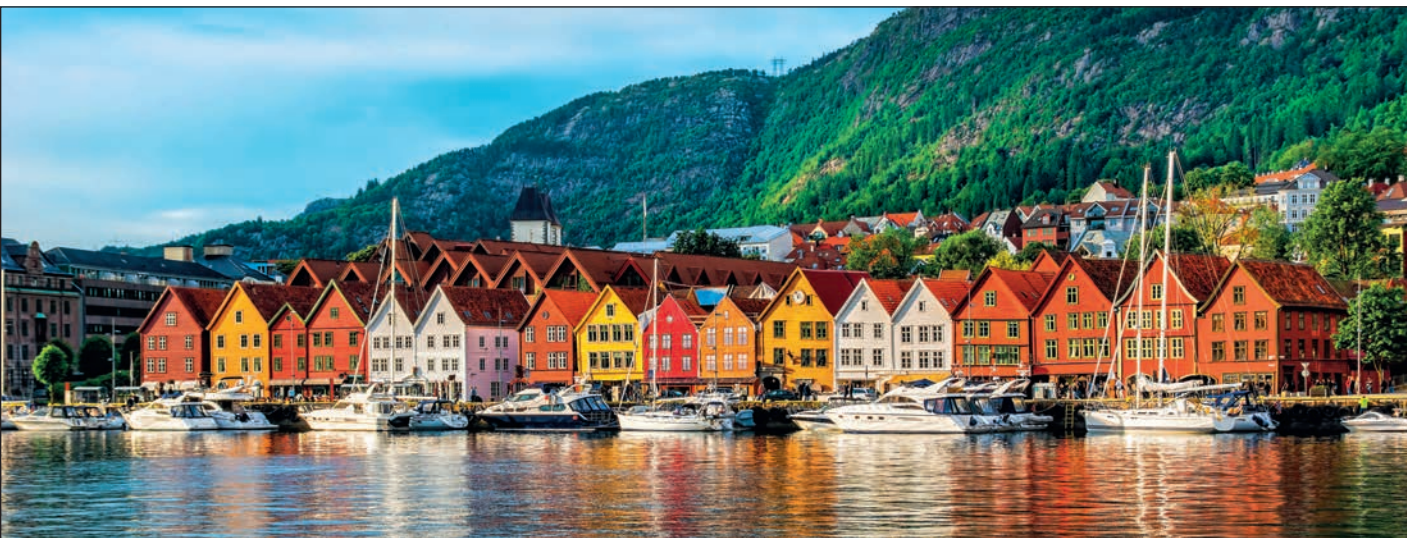
▲ Набережная Брюгген в старом Бергене