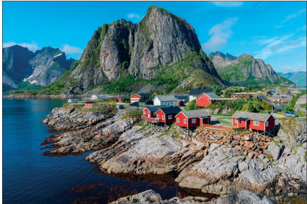
▲ От материка Лофотенские острова отделены проливом Вест-фьорд

В центре города возвышается готический кафедральный собор, построенный в 1956 г. Это одна из первых норвежских церквей с отдельно стоящей колокольней. Интерьеры храма украшены 12-метровым окном-витражом, голубеленами и окном-розеткой. Вблизи Будё расположен самый мощный в мире водоворот — Сальстраумен. Каждые 6 ч здесь образуются десятиметровые воронки, глубина которых достигает 5 м.