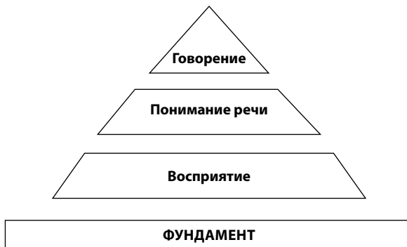
Рис. 2. Речевая пирамида