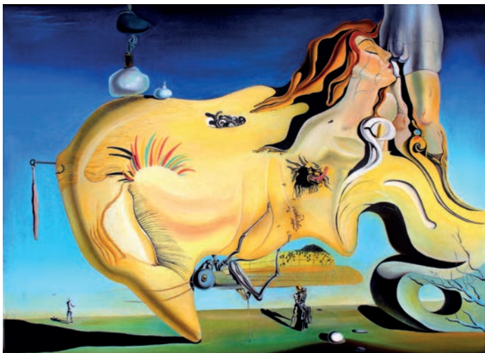
Сальвадор Дали. Великий Мастурбатор, 1929 г. Центр искусств королевы Софии, Мадрид