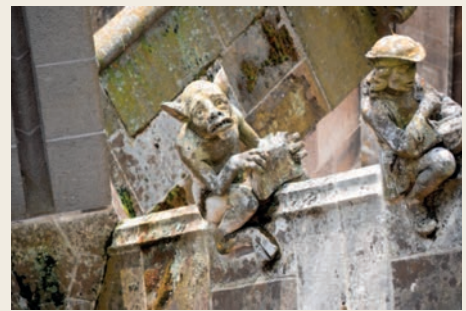
Детали экстерьера собора Святого Иоанна