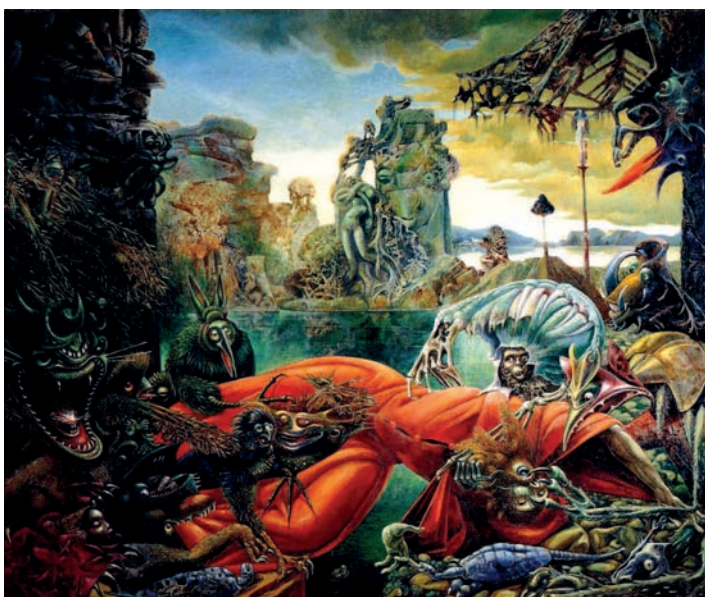
Макс Эрнст. Испытание святого Антония, 1945 г. Музей Вильгельма Лембрука, Дуйсбург