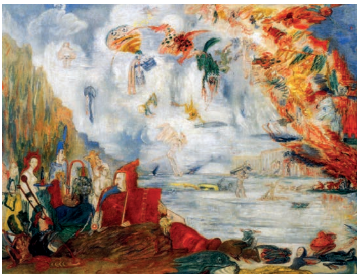
Джеймс Энсор. Испытания святого Антония, 1909 г. Музей современного искусства, Нью-Йорк