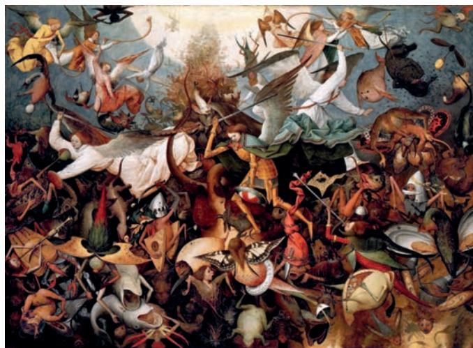
Питер Брейгель Старший. Падение мятежных ангелов, 1562 г. Королевские музеи изящных искусств, Брюссель

Каждое столетие на свой лад и манер осовременивает Иеронима Босха. Его прискорбный апокалиптизм и повальный эсхатологизм отозвался и в зрителе XX–XXI веков. Заново увиденный сюрреалистами в XX веке — Босх стал зеркалом ужасов Первой и Второй мировых войн. Сальвадор Дали ощутил и увидел в нём предвестника осмысления опыта и последствий коллективных травм, а также личного бессознательного, Эроса и Танатоса, о которых писал Зигмунд Фрейд. Благодаря психоаналитическим прочтениям произведений искусства, через работы не только Фрейда, но и Карла Густава Юнга, Иероним вновь приобрел актуальность. Классические искусствоведы XX столетия не могли обойти вниманием столь значимую фигуру: появились достаточно глубокие исследования, анализирующие Босха в контексте искусства Средневекового и Возрождения, к ним относятся рассуждения Эрвина Панофски, книги Вильгельма Френгера. Однако реконструкция смыслов картин Иеронима нуждалась в тщательном и долгом исследовании, в кропотливом и методичном труде, что стало делом будущих поколений исследователей, которыми стали Шарль де Тольнай и Людвиг фон Балдас, они приоткрыли завесу