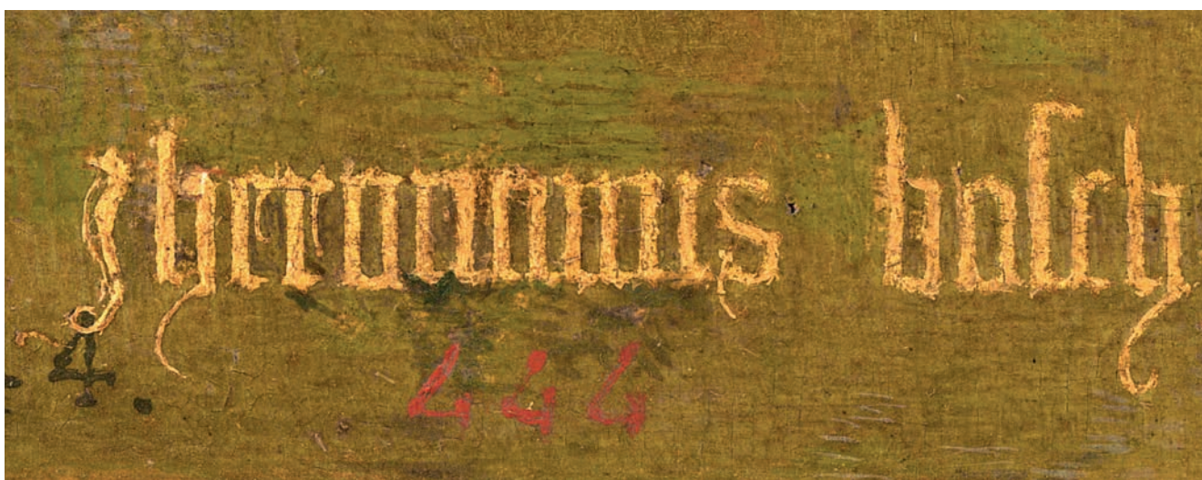
Автограф Иеронима Босха

Родовая фамилия Иеронима «ван Акен» связана с происхождением семьи из немецкого города Аахен. Прадедушка Иеронима — Томас ван Акен (ок. 1355–1404/10 годы) — переехал из Аахена в Неймеген (герцогство Гелдерланд, Нижние земли) в 1404 году и значился живописцем по профессии, как сообщают архивные записи. В XV веке Неймеген считался настоящим центром искусств со своей школой: оттуда происходят и братья ван Эйк, и братья Лимбург, и братья Майвайль.