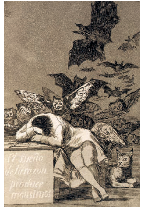
Франсиско Гойя. Сон разума рождает чудовищ, 1797–1799 гг. Национальная библиотека Испании, Мадрид

Даже всей совокупности идей и книг, гипотез и результатов, исследований и предположений никогда не будет достаточно, чтобы объяснить гений художника и культурный код его эпохи. Как писал о Босхе один из крупнейших искусствоведов XX века Эрвин Панофский: «Мы просверлили несколько отверстий в двери закрытой комнаты, но ключа к ней, кажется, так и не подобрали». Неизведанное и непроявленное, нераскрытое и загадочное манит нас и влечет в уникальный мир этого художника, мыслителя, творца — Иеронима Босха.