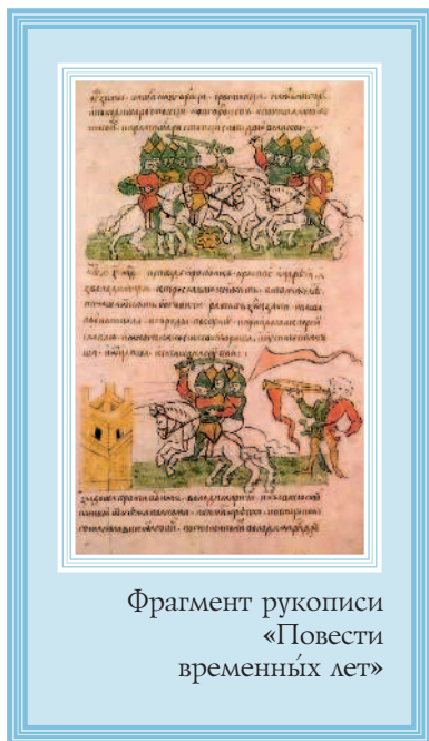
Фрагмент рукописи «Повести временных лет»

«Повесть временных лет» была написана приблизительно в 1113 году. Это время расцвета первого русского государства — Киевской Руси. Сильное, передовое, процветающее государство нуждалось в книге, которая год за годом расскажет о его истории. Поэтому название «Повесть временных лет» буквально означает «рассказ о событиях, изложенный по годам». Произведение Нестора заложило основы русской летописи, им начались все последующие летописные своды.