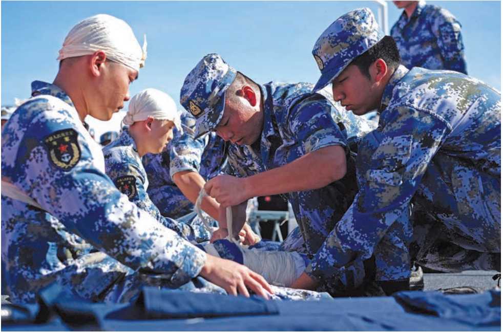
На госпитальном судне «Хэпин Фанчжоу» проходит тренировка по спасению раненых

напряженная работа — все должны были подвести итоги дня приема и в то же время в целом спланировать задачи на следующий день. На второй день посещения судна было получено срочное задание.