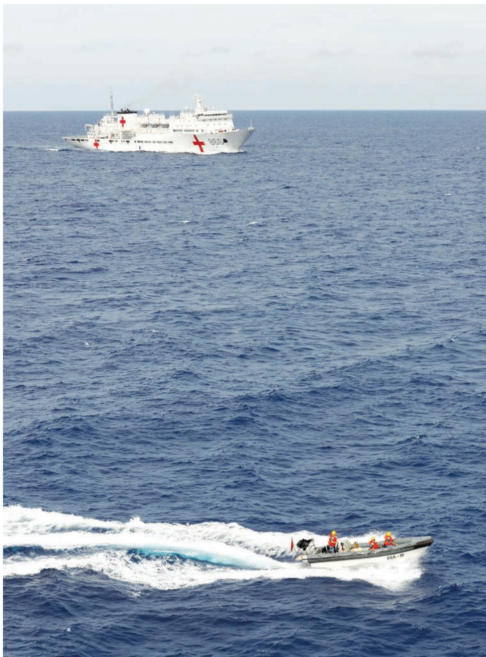
Госпитальное судно «Хэтин Фанчжоу» вместе со скоростным катером спасает людей, тонущих в море