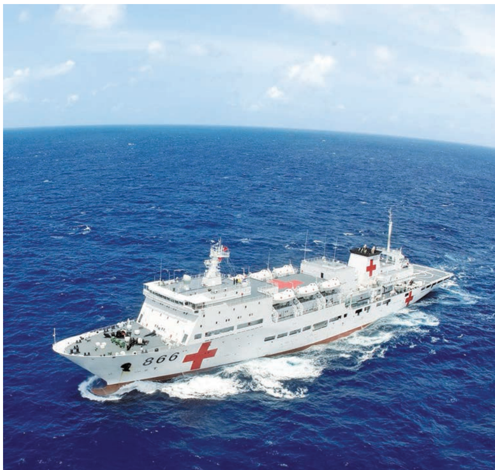
Госпитальное судно «Хэтин Фанчжоу» плывет по синему морю