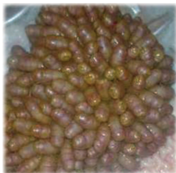
Личинки овода в желудке лошади

кусают лошадей. Они подлетают к ноздрям, впрыскивают слизь, содержащую маленькие личинки, в ноздри или на губы лошади, лошади сглатывают слизь, и готово: личинки попадают в желудок. В желудке личинки буквально вбуравливаются в слизистую оболочку и начинают расти. После того как личинки полностью сформировались, они покидают свой «инкубатор» и выходят наружу с навозом. Их можно обнаружить в кале лошадей обычно зимой