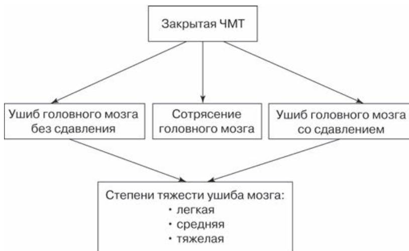
Схема 2. Классификация ЗЧМТ

В настоящее время наиболее распространенной является классификация, рекомендованная III съездом нейрохирургов и утвержденная МЗ РФ (схема 2).